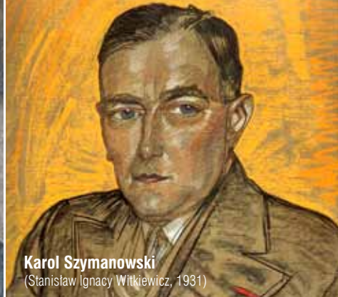
Karol Szymanowski (Stanisław Ignacy Witkiewicz, 1931)