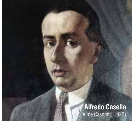
Alfredo Casella (Felice Casorati, 1926)